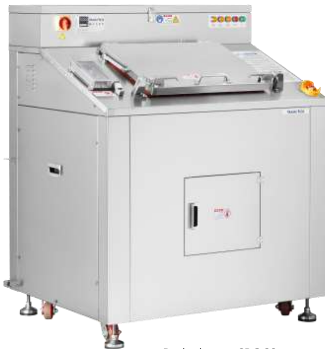
Deshydrateur SDG 80

Les déchets alimentaires comportent 80% d'eau Les transporter BRUT est un non-sens économique et écologique.